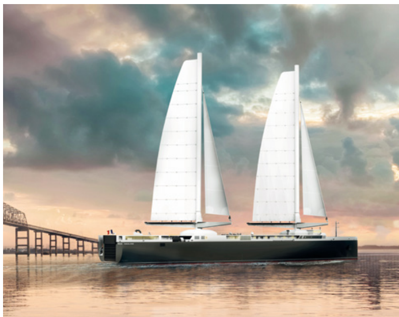
Projet de Neoliner

“Nous sommes fiers de nous engager aux côtés des pionniers du transport maritime décarboné à la voile : Neoline, dont le chantier de construction du navire a commencé, et Zéphyr et Borée avec lesquels nous venons de signer un contrat. Hennessy a l'ambition de réduire de 50 % ses émissions carbone à horizon 2030 sur le scope 3 (qui inclut le transport), la solution vélique s'inscrit totalement dans cette démarche environnementale. Sur le transport terrestre, la priorité donnée au ferroviaire et aux biocarburants complète notre roadmap de décarbonation.”