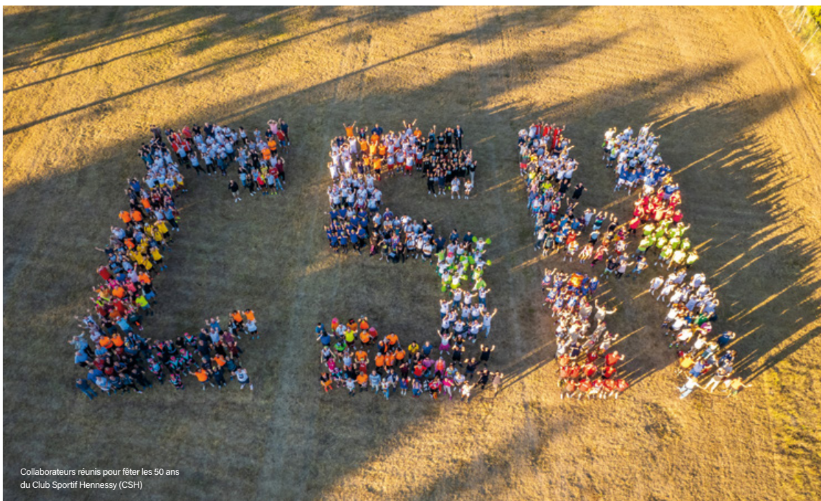
Collaborateurs réunis pour fêter les 50 ans du Club Sportif Hennessy (CSH)