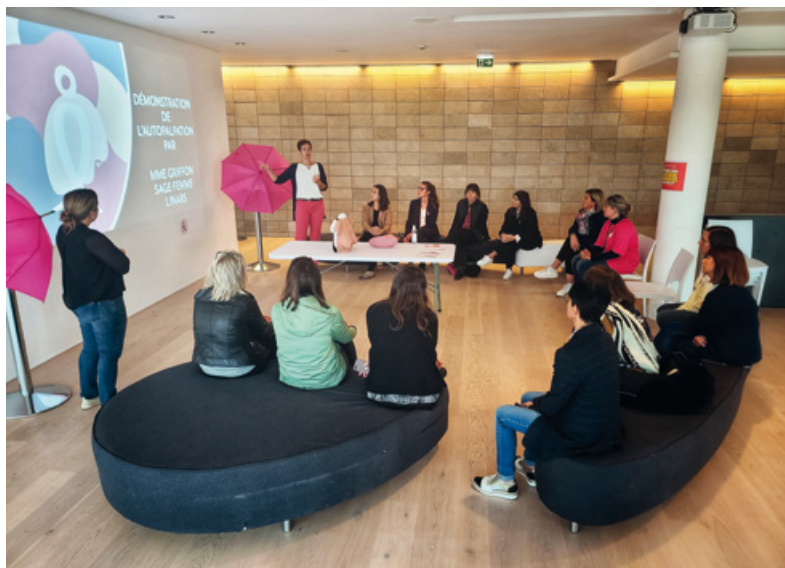
Atelier de prévention du cancer du sein, Octobre Rose 2022

En collaboration avec Sport Santé Charente, deux coachs sont intervenus auprès des tonneliers et agents de chais de la Maison : d'abord pour réaliser un bilan individuel de leurs capacités motrices (niveau de souplesse, rapport poids/puissance...) puis leur fournir un programme d'exercices simples de motricité personnalisé. S'en est suivi pour chaque participant un coaching hebdomadaire pendant cinq semaines sur la base des résultats obtenus, avec un bilan final.