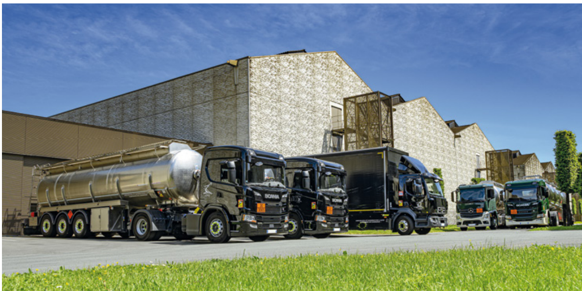
Panel de la flotte interne de camions Hennessy

LE TRANSPORT REPRÉSENTE 12 % EN 2021 DES ÉMISSIONS CARBONE D'HENNESSY QUI MET EN PLACE DES ALTERNATIVES DURABLES POUR SES FLOTTES INTERNES COMME POUR LE FRET.