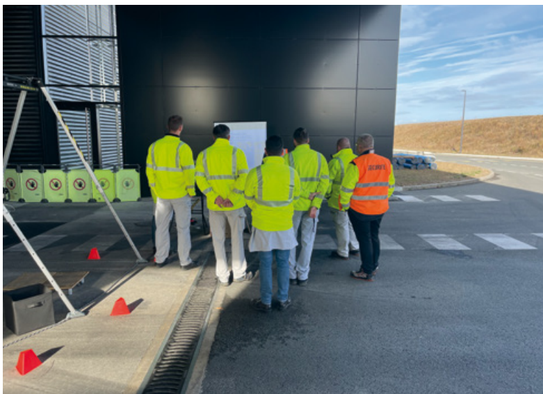
Formation à la sécurité organisée sur le site de Pont Neuf