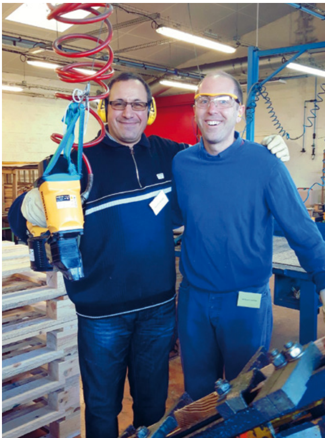
Collaborateur de la Maison en mécénat de compétences (à droite) et membre de l'Arche (à gauche)