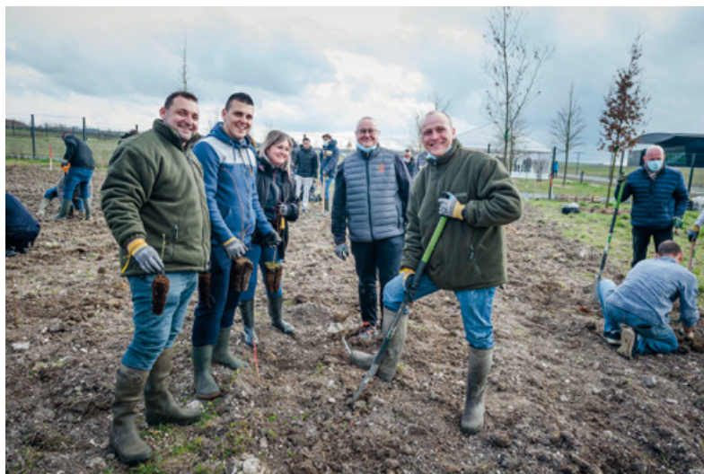
Plantation participative avec les salariés Hennessy du site de Pont Neuf

“La météo n’était pas au rendez-vous, mais la bonne humeur si ! Après un questionnaire et des conseils, par petits groupes nous avons planté cinq espèces d’arbres différentes : chênes, tilleuls, érables, charmes, noisetiers... Ce qui est enthousiasmant c’est que nous allons pouvoir observer l’évolution de cette plantation puisqu’elle se situe sur notre lieu de travail.”