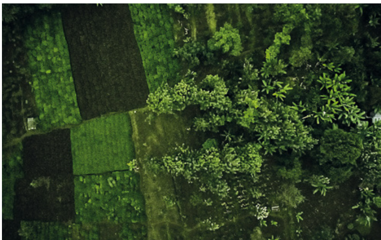
Forêt-jardin vue du ciel, Mont Kenya, Kenya