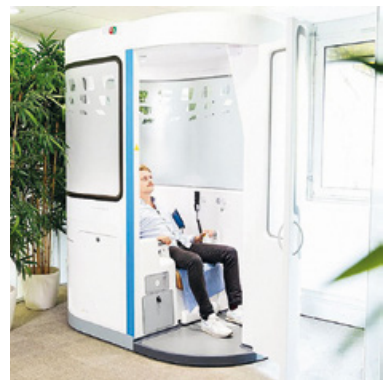
Cabine de télé médecine installée au siège social de la Maison Hennessy

En complément, les collaborateurs ont la possibilité de rencontrer une psychologue libérale, en alternance à La Richonne et à la Vignerie, site de mise en bouteille de la Maison, qu'il s'agisse de questions professionnelles ou personnelles.