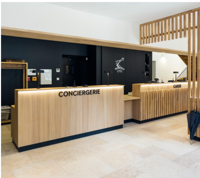
Nouveaux espaces pour le magasin de ventes au personnel et la conciergerie

Un nouveau lieu convivial a également vu le jour en 2022 : le James Café, qui permet aux salariés de se retrouver pour un petit déjeuner ou une pause-café.