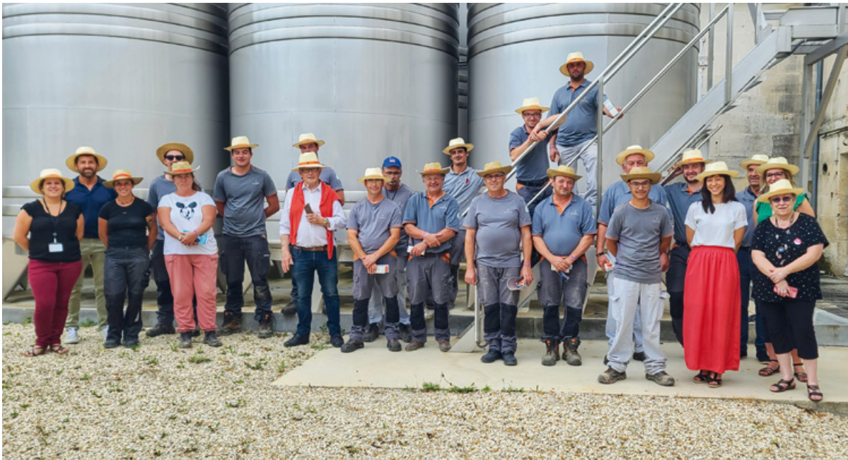
Collaborateurs travaillant en extérieur dans les vignobles Hennessy, réunis pour la campagne de prévention du mélanome