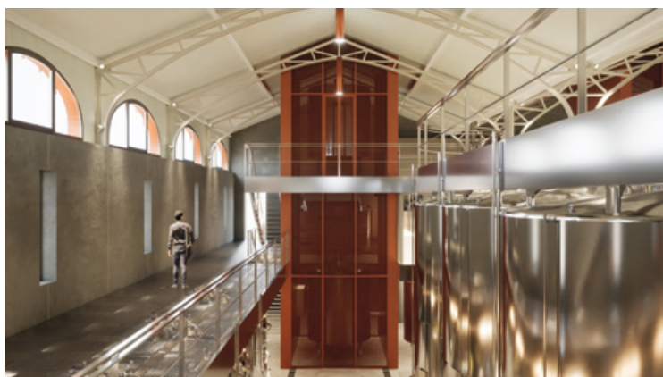
Future unité de vinification du site Le Peu

100 % des bâtiments rénovés ou en cours de rénovation selon le référentiel HQE