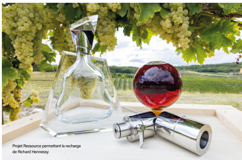
Projet Ressource permettant la recharge de Richard Hennessy

“Un de nos enjeux aujourd'hui est de sensibiliser et d'éduquer nos consommateurs en Asie et aux États-Unis à la notion d'éco-conception qui y est encore peu développée.”