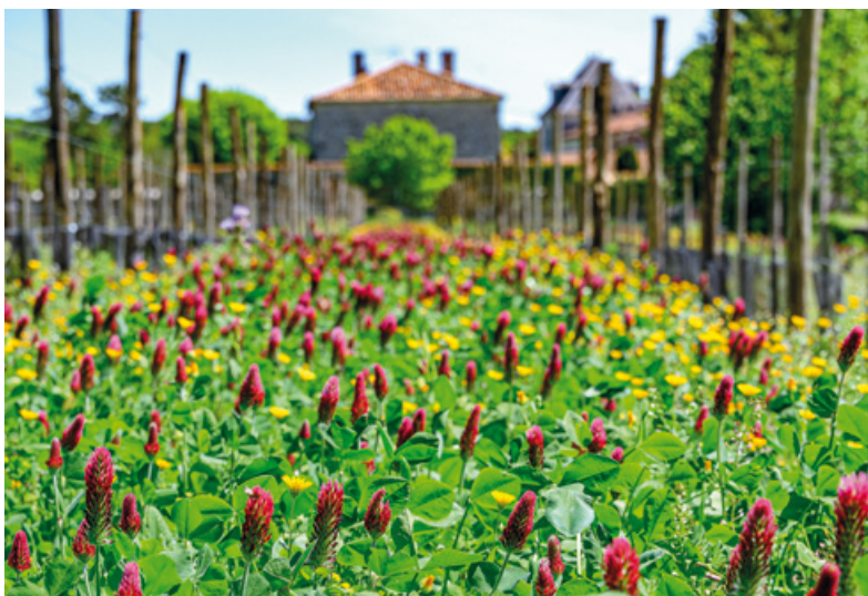
Couverts végétaux avec trèfles incarnat sur le vignoble de la Bataille

FACE AUX ENJEUX DU CHANGEMENT CLIMATIQUE, À L'APPAUVRISSEMENT DES SOLS ET DE LA BIODIVERSITÉ, LA MAISON TESTE ET DÉPLOIE SUR SON VIGNOBLE EN PROPRE DES PRATIQUES AGRICOLES PLUS VERTUEUSES.