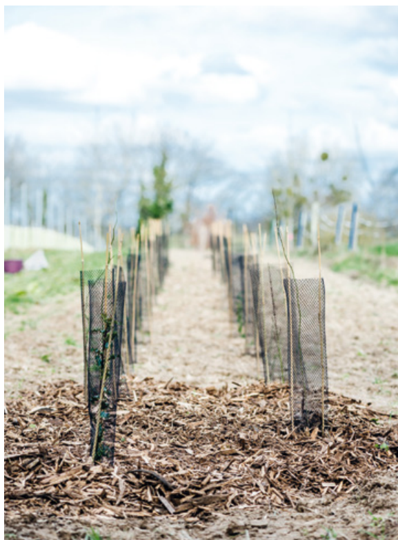
Jeune plant formant à termes une haie, chez un partenaire viticulteur

Le projet 1 000 Palisses vise à développer des systèmes de production viti/vinicoles résilients au changement climatique et à participer à la reconstitution de trames vertes et bleues favorables à une biodiversité riche et variée sur des parcelles agricoles. Un enjeu essentiel lorsque l’on sait que la Plateforme Inter-gouvernementale Scientifique et Politique sur la Biodiversité et les Services Écosystémiques (IPBES) a identifié la fragmentation des territoires et l’artificialisation des milieux comme facteurs majeurs de l’érosion de la biodiversité. Pour qu’un projet soit une “Solution fondée sur la Nature”, il doit respecter les critères du standard international de l’UICN et notamment faire preuve d’une gouvernance inclusive, intégrant des parties prenantes du sujet et du territoire. 1000 Palisses répond pleinement à ces problématiques.